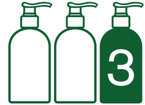
Gel de Baño